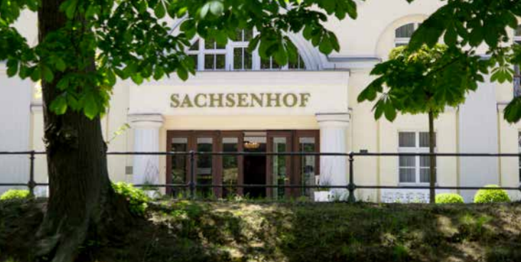
Celenus Fachklinikum Sachsenhof