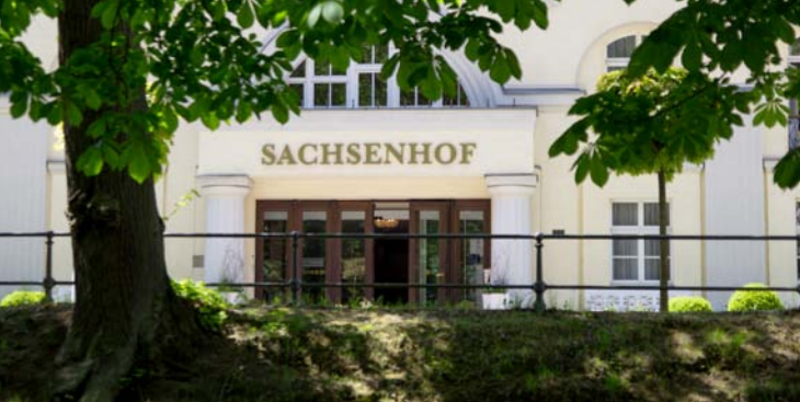
Celenus Fachklinikum Sachsenhof