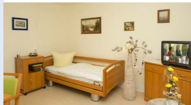
Bewohnerzimmer der Alloheim Senioren-Residenz „Haus am See“

Viele Betroffene bezahlen für das tapfere Durchhalten mit ihrer Gesundheit: Erschöpfungszustände, depressive Verstimmungen, Angst, psychosomatische Erkrankungen und chronische Schmerzen sind häufig die Folge der dauerhaften Überforderung. Erschwerend kommt hinzu, dass eine große räumliche Trennung vom Pflegebedürftigen für die pflegenden Angehörigen oft gar keine Erleichterung sondern eher noch eine weitere psychische Belastung darstellt. Denn häufig ist nicht sichergestellt, dass der Pflegebedürftige während der Abwesenheit seines Pflegers trotzdem die qualitativ hochwertige Pflege bekommt, die er braucht. Viele Pflegenden verzichten deshalb auf das notwendige Auffüllen der eigenen Ressourcen.