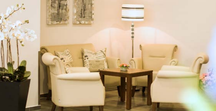
Sitzgruppe im Eingangsbereich Alloheim Senioren-Residenz „Haus am See“