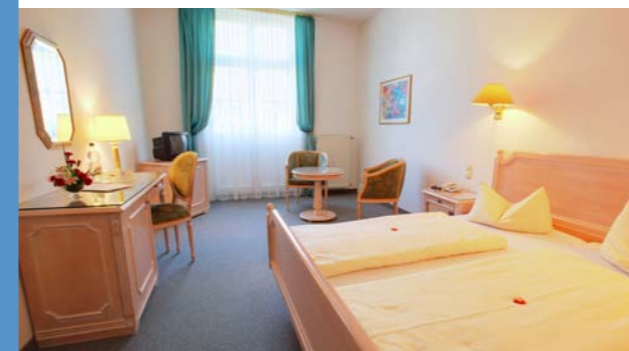
Patientenzimmer des Celenus Fachklinikum Sachsenhof

Ist eine Pflegeperson wegen Urlaub, Rehamaßnahme, Krankheit oder anderer Gründen an der Pflege ihres Angehörigen gehindert, übernimmt die Pflegekasse die Kosten einer notwendigen Ersatzpflege für längstens vier Wochen je Kalenderjahr.