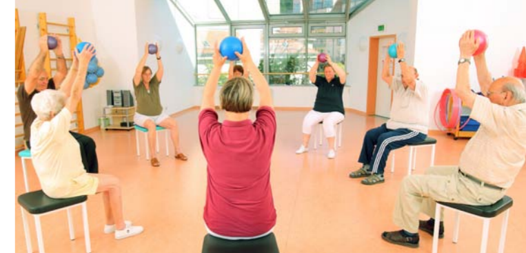
Gruppentherapie im Celenus Fachklinikum Sachsenhof