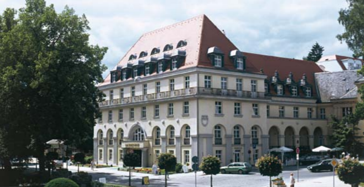
Celenus Fachklinikum Sachsenhof