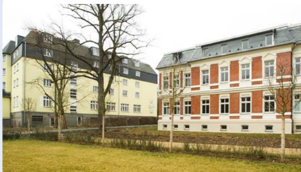
Außenansicht der Alloheim Senioren-Residenz „Haus am See“