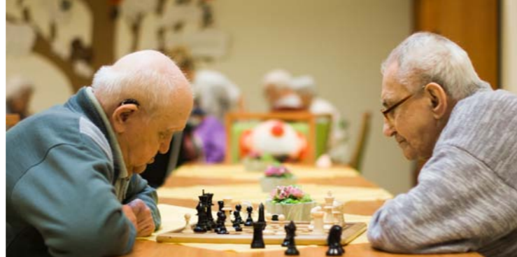
Ergotherapie der Alloheim Senioren-Residenz „Haus am See“