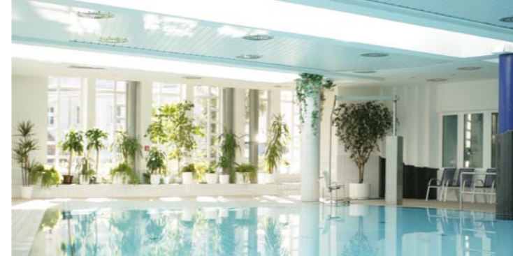
Schwimmbad des Celenus Fachklinikum Sachsenhof