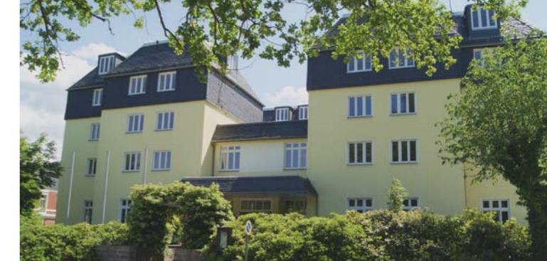
Alloheim Senioren-Residenz „Haus am See“