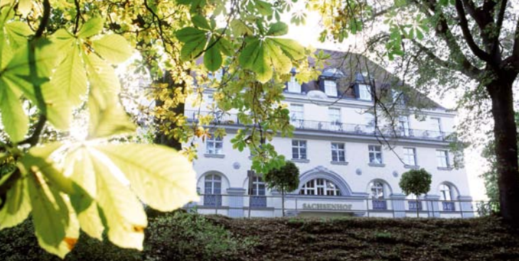
Celenus Fachklinikum Sachsenhof