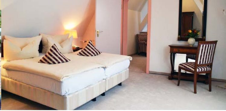
Schlafzimmer unserer Suite, die gegen Aufpreis buchbar ist