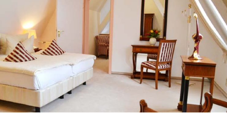
Schlafzimmer unserer Suite, die gegen Aufpreis buchbar ist