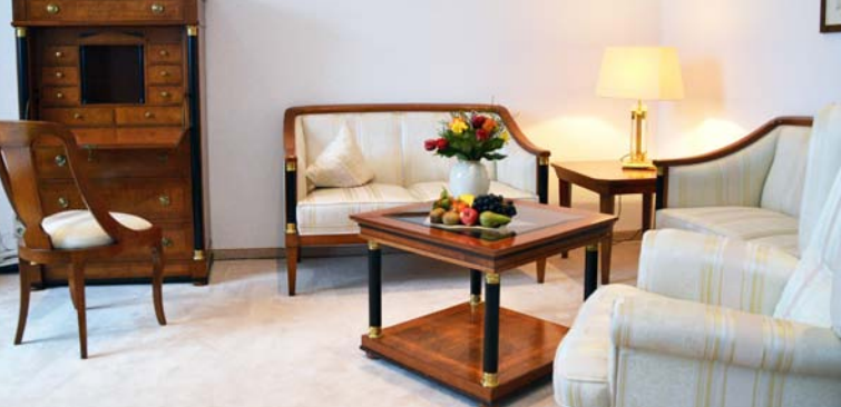
Sitzecke unserer Suite, die gegen Aufpreis buchbar ist